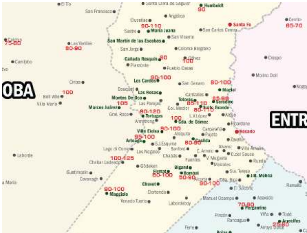
Rendimientos medios de Maíz 1ra, registrados hasta la presente Semana (qq/ha).

El cultivo de maíz de segunda se encuentra en buenas condiciones, en estado de grano lechoso-pastoso, sin inconvenientes importantes de enfermedades y en cuanto a plagas presencia de oruga de la espiga.